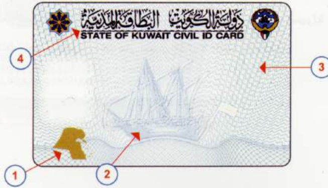
شكل رقم (1) تصميم البطاقة المدنية

4 - العبارة المطبوعة على الخط الفاصل بين العنوان الرئيسي للبطاقة باللغة العربية والعنوان الرئيسي باللغة الإنجليزية وتتكون من العبارة المتكررة « دولة الكويت » مطبوعة بجودة عالية للغاية وبحجم متناهي في الصغر MICROPRINT وترى فقط بالمكبر وليس بالعين المجردة